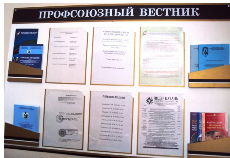
Стенд профкома СОШ №1 Алексеевского района