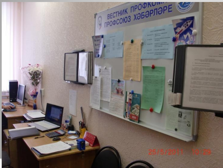
Стенд профкома гимназии №6 Приволжского района г.Казани